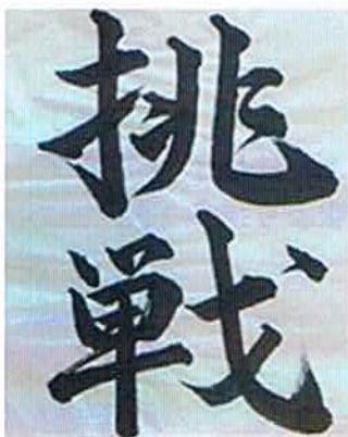
28年度交通遺児友の会書道コンテスト 最優秀賞(国土交通大臣賞)

この「ナスバギャラリー IN 東京」は、交通遺児等のコンテスト入賞の書道作品や重度後遺障害者の方々による創作作品等の展示を通して、自動車事故被害者の現況を知って頂き、同様の被害者を発生させてはならないという事故防止の意識の醸成を図るとともに、ナスバが行う被害者援護業務のPRと自賠責保険の確実な加入を促すための広報・啓発活動を併せて行うこととしています。是非お立ち寄り、ご高覧下さい。