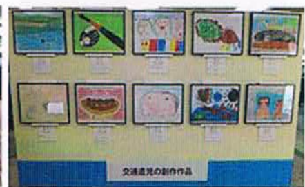
昨年の「ナスバギャラリー IN 東京」の様子